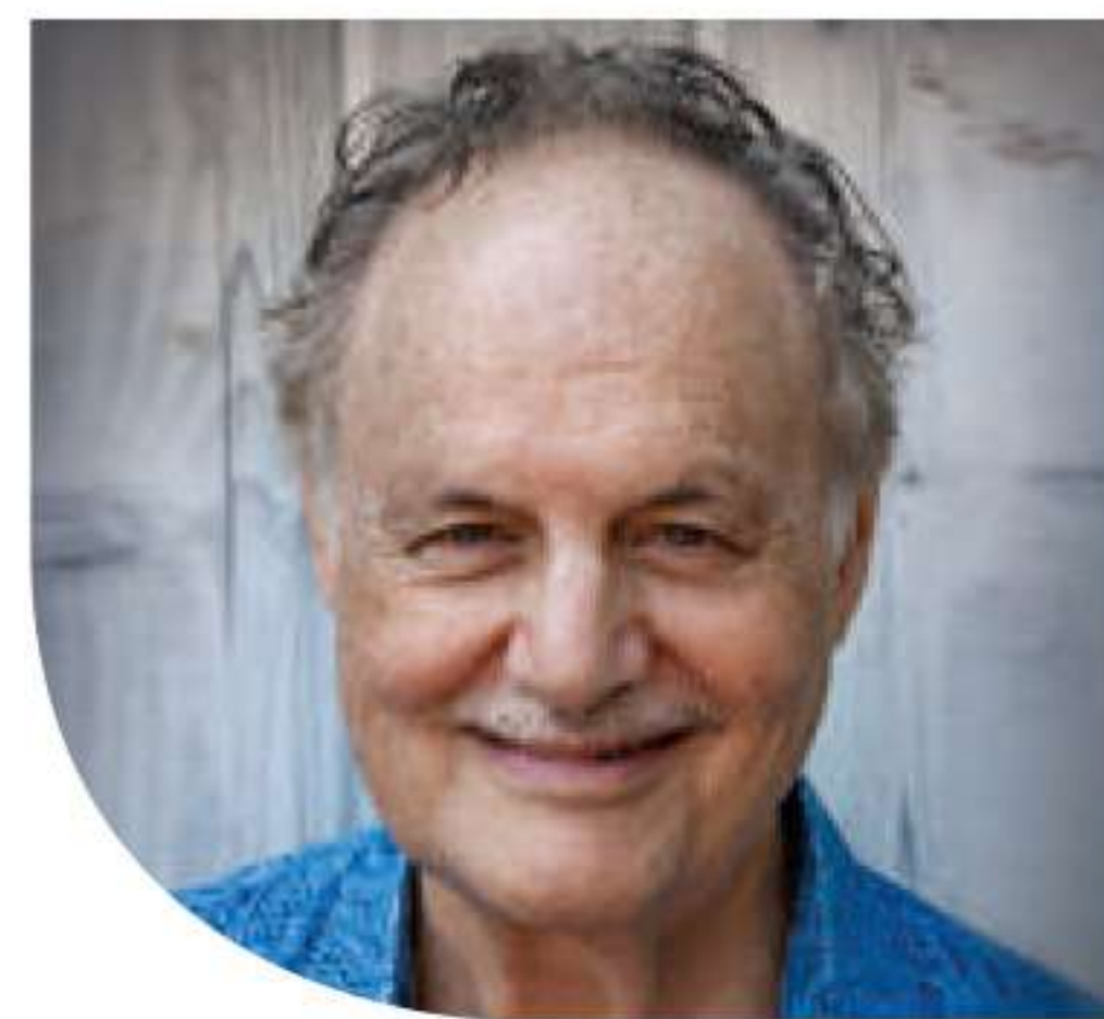
デヴィッド・フリードマン