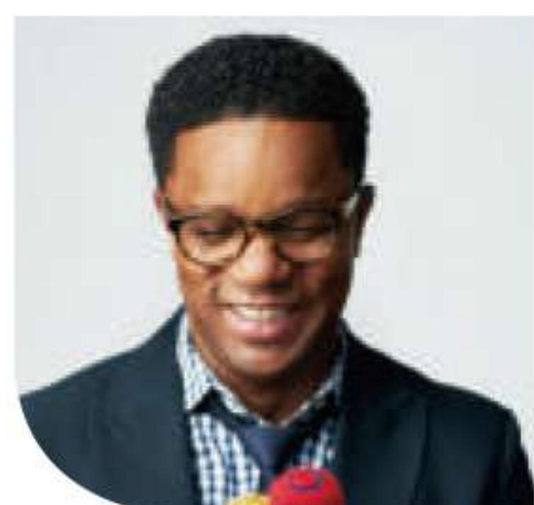
ステフオン・ハリス