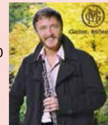
アルブレヒト・マイヤー ベルリンフィルハーモニー管弦楽団 首席オーボエ奏者

160…………… ¥850,000 180…………… ¥1,170,000 180D…………… ¥1,320,000