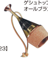
ゲシュトッブ オールプラス【119】