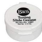
チューニング スライドグリス【1887】