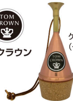
ゲシュトッブコパー (一部プラス)