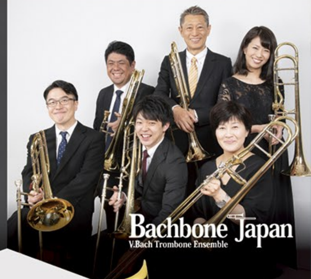
Bachbone Japan V.Bach Trombone Ensemble