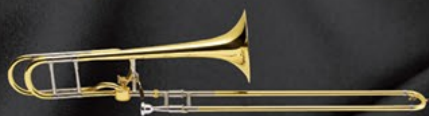
42A <GL> ¥500,000 (税抜)