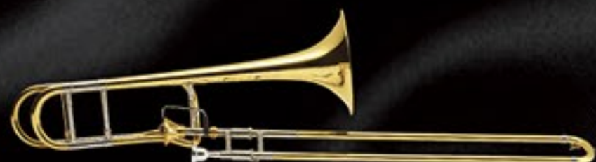
42AF <GL> ¥490,000 (税抜)