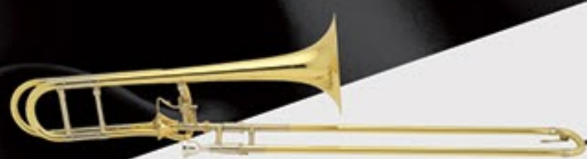
A471 <GL> ¥635,000 (税抜)