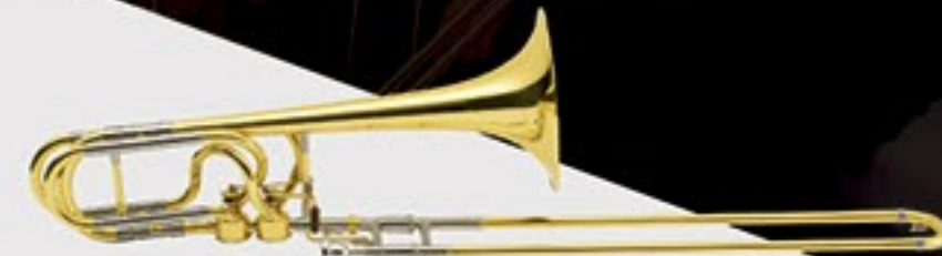
50A3 <GL> ¥757,000 (税抜)