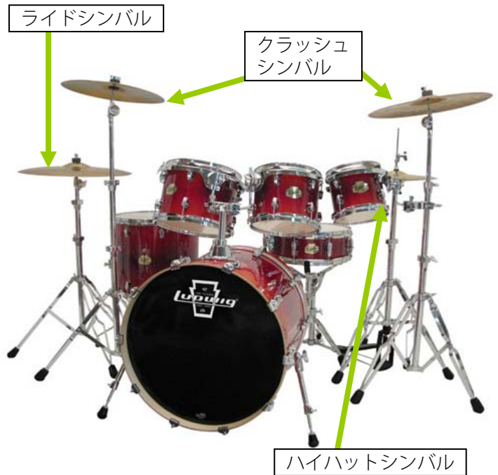
参考ドラムセット：ラディック LCB20FX